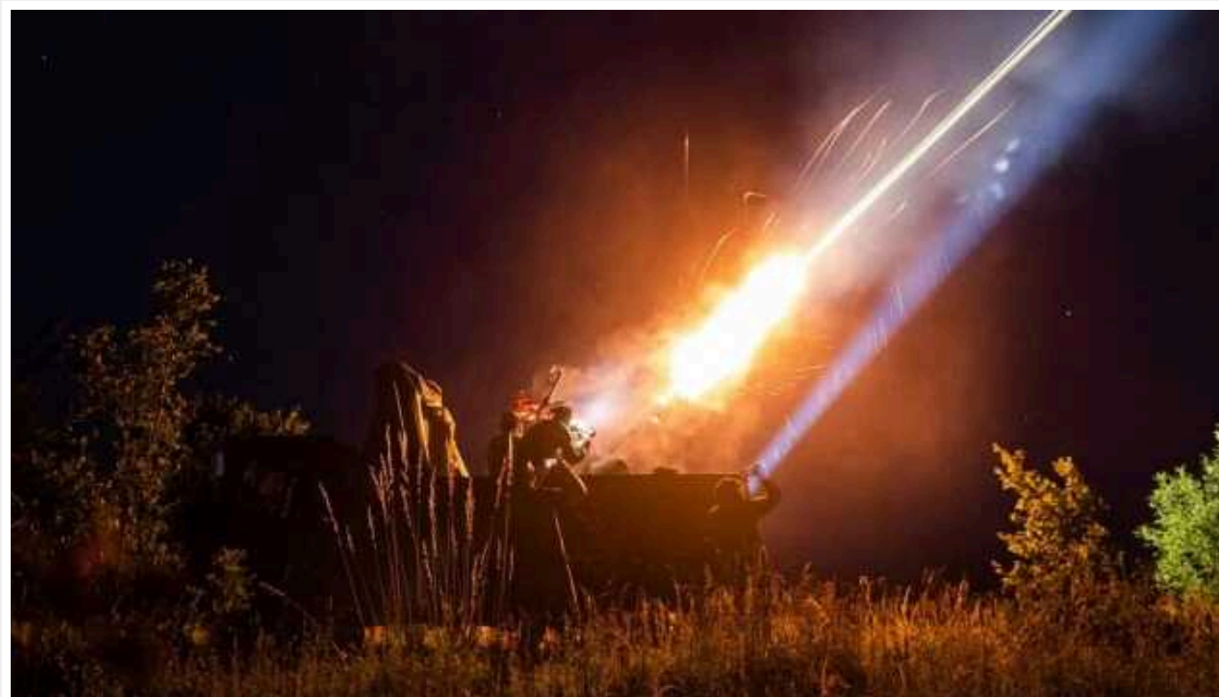
Сили ППО вночі знищили 10 із 16 «шахедів»

Цієї ночі підрозділи мобільних вогневих груп Повітряних сил та Сил оборони України знищили 10 із 16 ударних БПЛА типу Shahed-136/131.