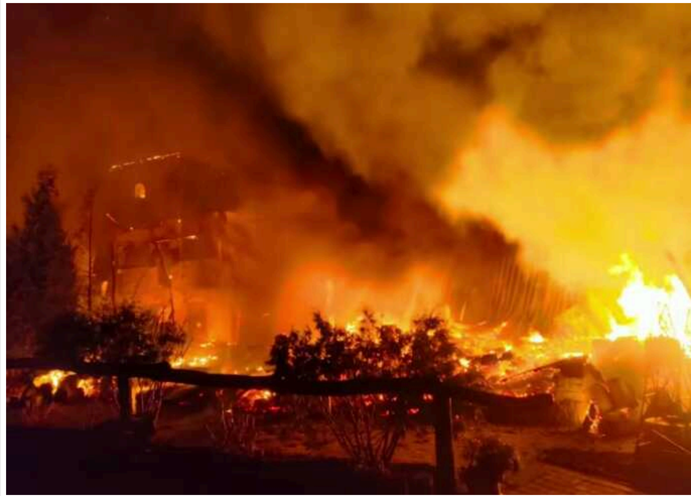
Атака БПЛА на Харківщині: палали будинки, готель, ресторан і автівки

Уночі 9 лютого російські війська атакували "шахедами" Харківську область – у Зміївській громаді горіла цивільна інфраструктура, одна людина постраждала.