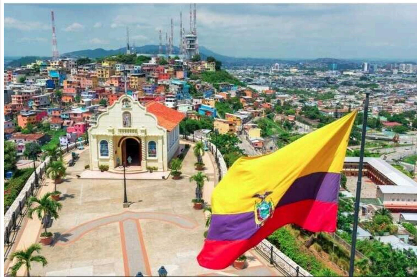
Еквадор розглядає можливість передати США старі радянські озброєння: потім можуть віддати Україні

Заступник держсекретаря Кевін Салліван, який побував у Кіто, повідомляє, що Еквадор розглядає можливість передати США старі радянські озброєння, які потім Вашингтон зможе віддати Україні.