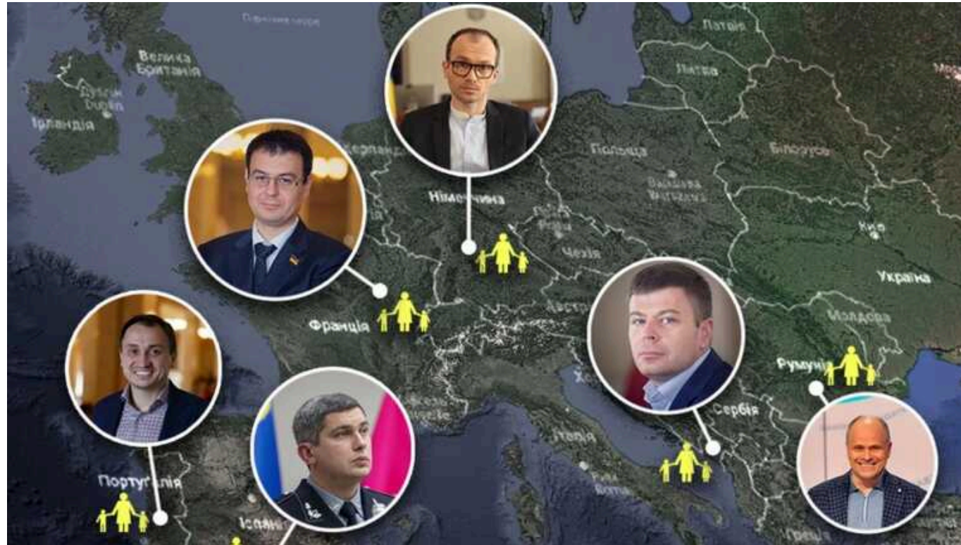
Де українські чиновники ховають від війни своїх рідних: від Швейцарії до Чорногорії

У нещодавньому інтерв'ю швейцарському виданню Tages-Anzeiger радник Голови ОП Сергія Лещенко заявив, що «приймаючі країни повинні приняти підтримку біженців, щоб українці повернулися додому». Журналісти «Слідство.Інфо» проаналізували декларації високопосадовців і встановили, чії родини виїхали за кордон з початку і під час повномасштабного вторгнення.