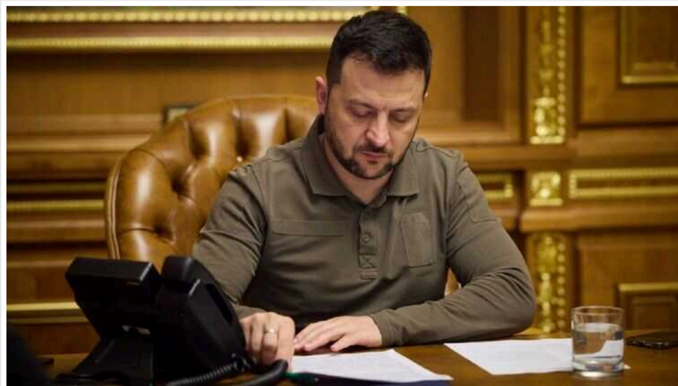
Залужний вважав нереалістичними накази Зеленського та безпосередньо вів переговори з союзниками щодо постачання, - The Times

Видання The Times стверджує, що Залужний вважав нереалістичними накази Зеленського і безпосередньо вів переговори із союзниками про постачання, виключаючи Міноборони з цього процесу.