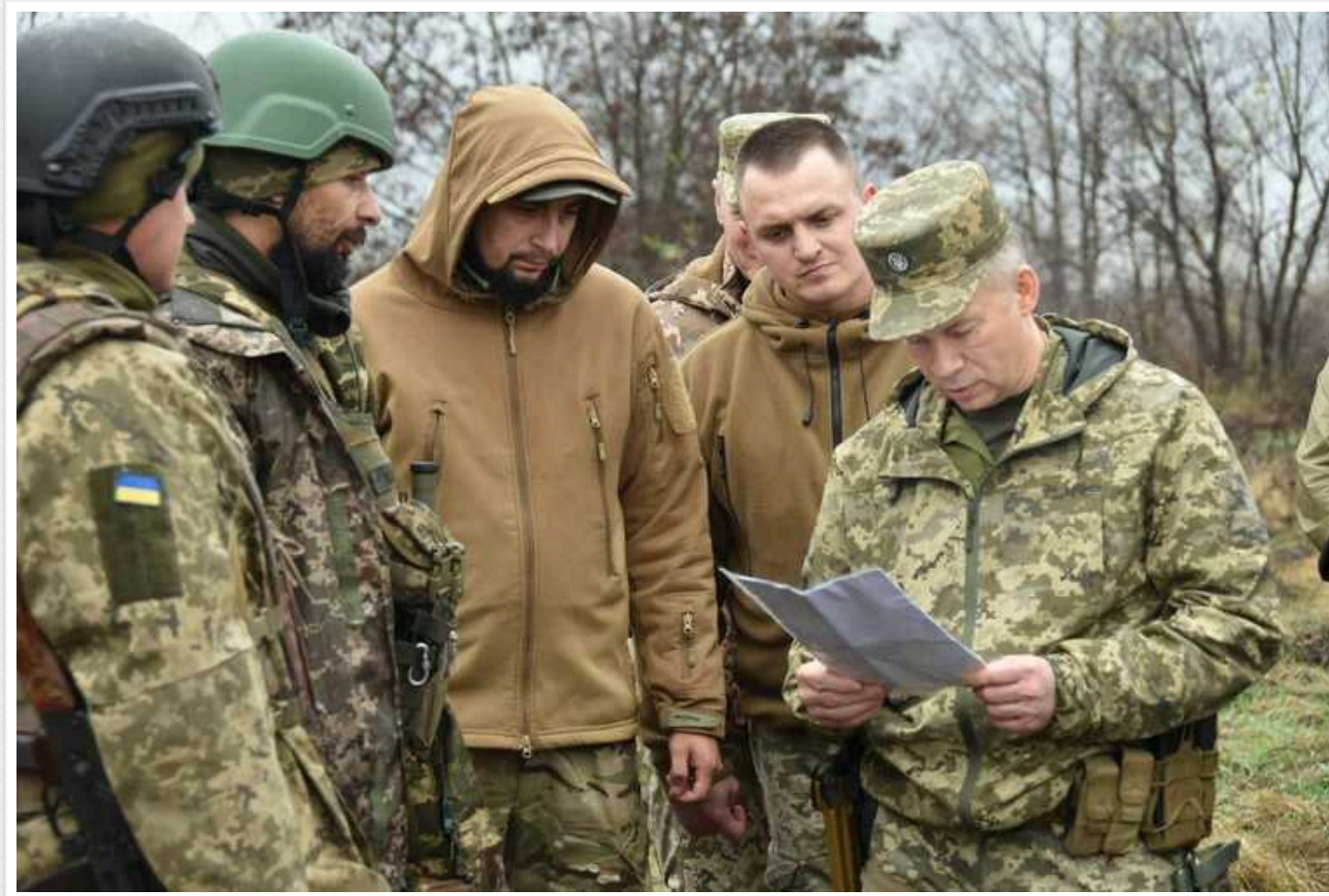
Призначення Сирського, імовірно, не сподобається українським військовим і населенню, - The Washington Post

The Washington Post пише, що заміна Залужного Сирським, ймовірно, не сподобається українським військовим та населенню.