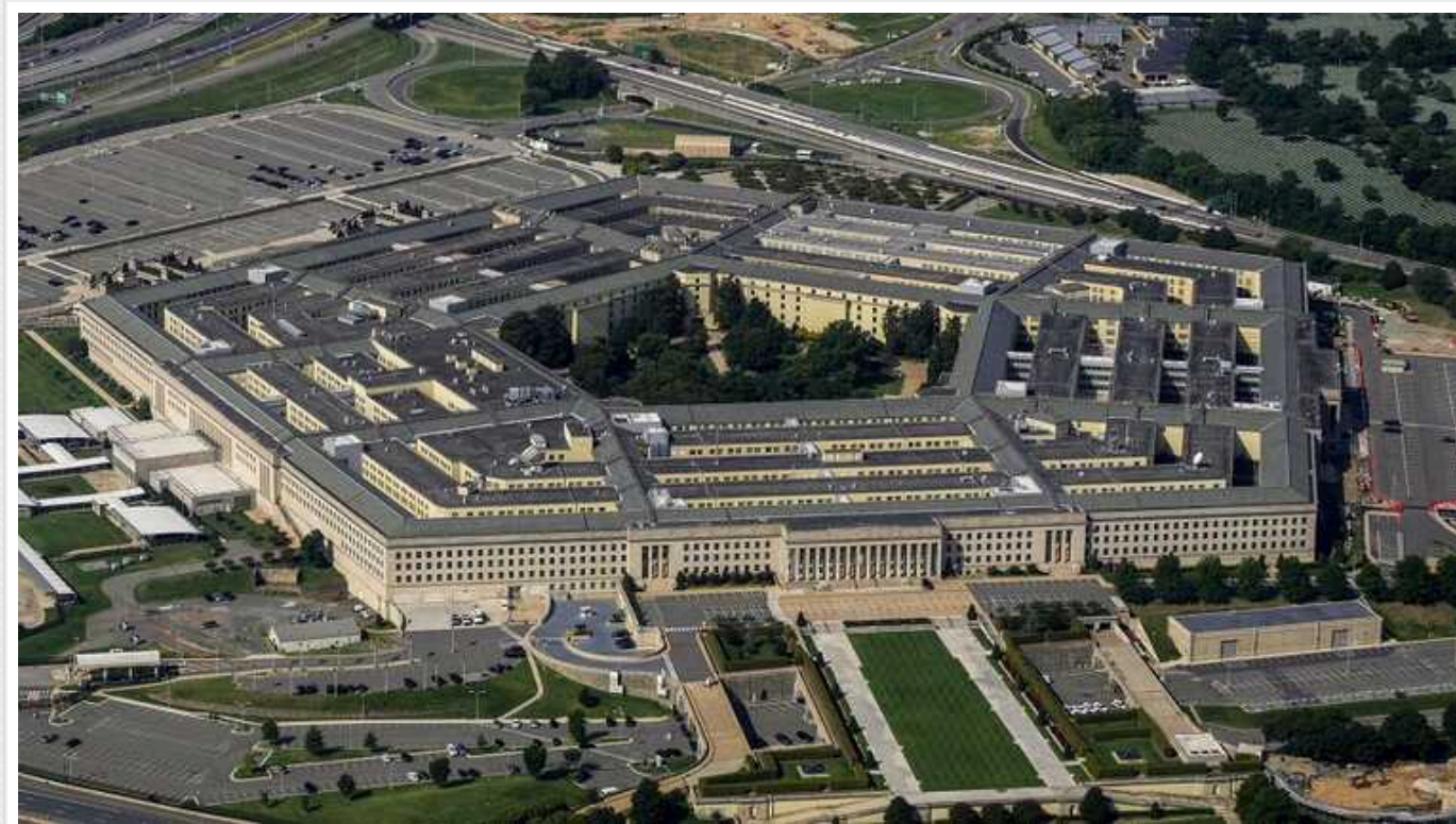
Ми будемо підтримувати Україну, незважаючи на відставку Залужного, - Пентагон

У Пентагоні заявили, що США підтримуватимуть Україну, незважаючи на відставку Залужного.