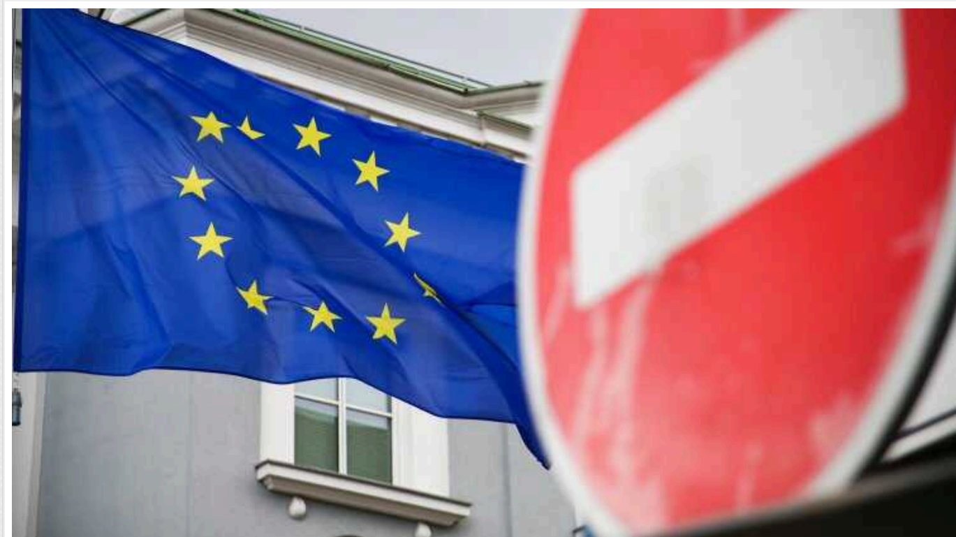
Bloomberg: В Євросоюзі хочуть запровадити санкції проти колишнього охоронця Путіна

У рамках нового – 13-го – пакету санкцій проти Росії Євросоюз може накласти обмеження на понад 60 фізичних осіб – у т.ч. колишнього охоронця президента Росії Володимира Путіна Олексія Дюміна, який нині перебуває на посаді губернатора Тульської області. Також обмеження можуть запровадити проти 55 компаній, що займаються, зокрема, виробництвом зброї, а також ключових технологій та електроніки, які використовуються російськими оборонними компаніями.