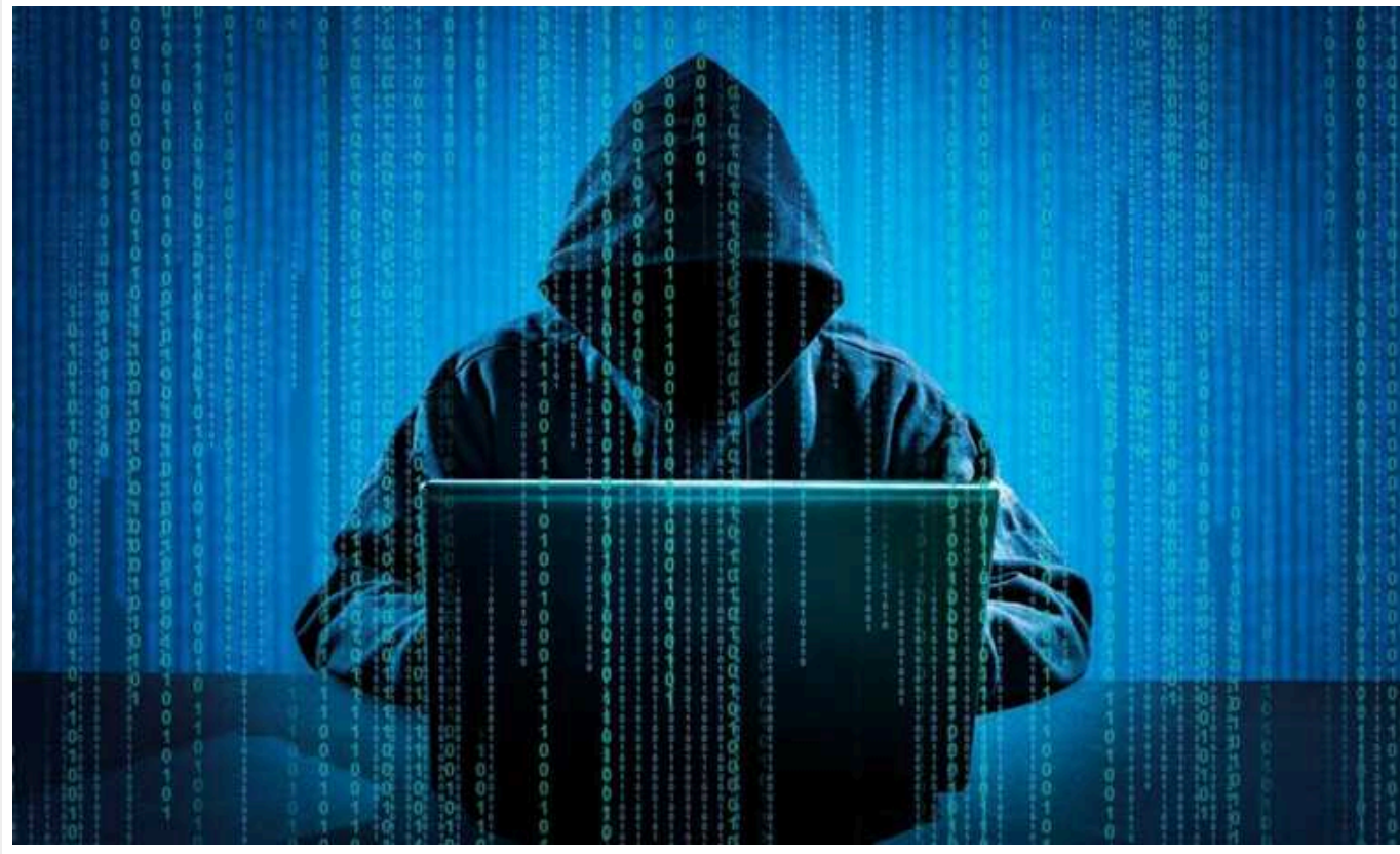
Reuters: Хакери з КНДР вкрали 3 мільярди доларів для фінансування розробки ядерної програми

ООН розслідує майже 60 кібератак з боку КНДР, які принесли країні 3 мільярди доларів. Ці гроші Північна Корея використала аби розвивати свою ядерну програму, повідомляє Reuters із посиланням на неопубліковану доповідь ООН.