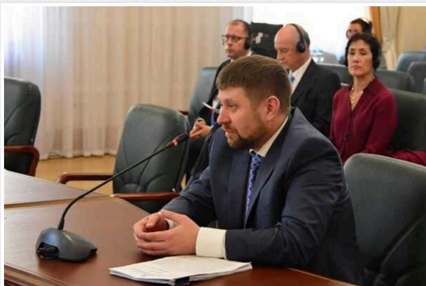
Суддя Максим Ковбель, якого визнали корупціонером, продовжує здійснювати судочинство: у зв'язку із закінченням строків давності звільнили від покарання

ВАКС визнав голову Васильківського суду Київської області Максима Ковбеля винним у недостовірному декларуванні квартири та двох паркомісць на 5 000 000 грн у столичному ЖК "Ізумрудний" (ч.1 ст. 366-2 ККУ). Майно було оформлено на тещу, яка мешкала в Тернополі.