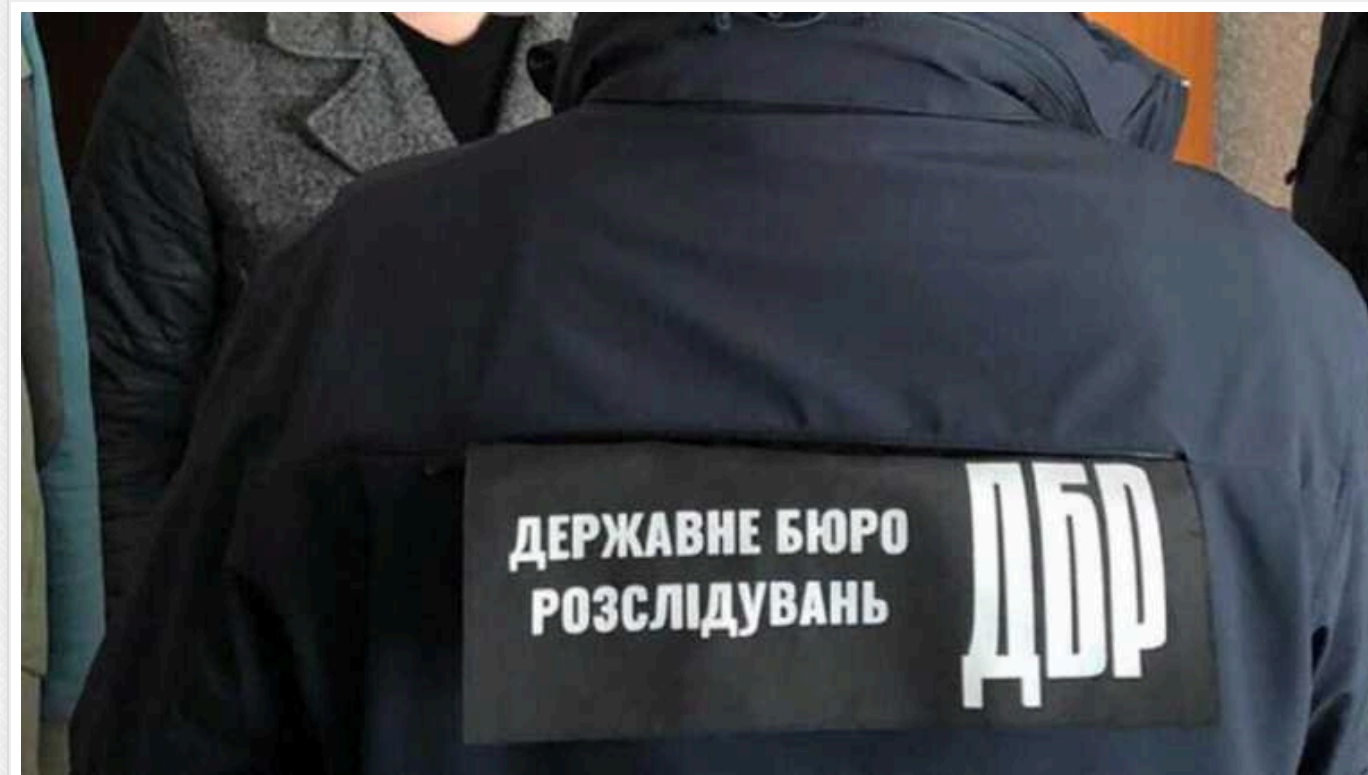
Правоохоронця з Буковини віддали під суд: організував схему нелегального виїзду ухлянтів до ЄС

Правоохоронця з Буковини та чотирьох його спільників судитимуть за організацію схеми нелегального виїзду ухлянтів через український кордон до Румунії. За весь "пакет" послуг ділки брали від 3500 до 6000 євро.