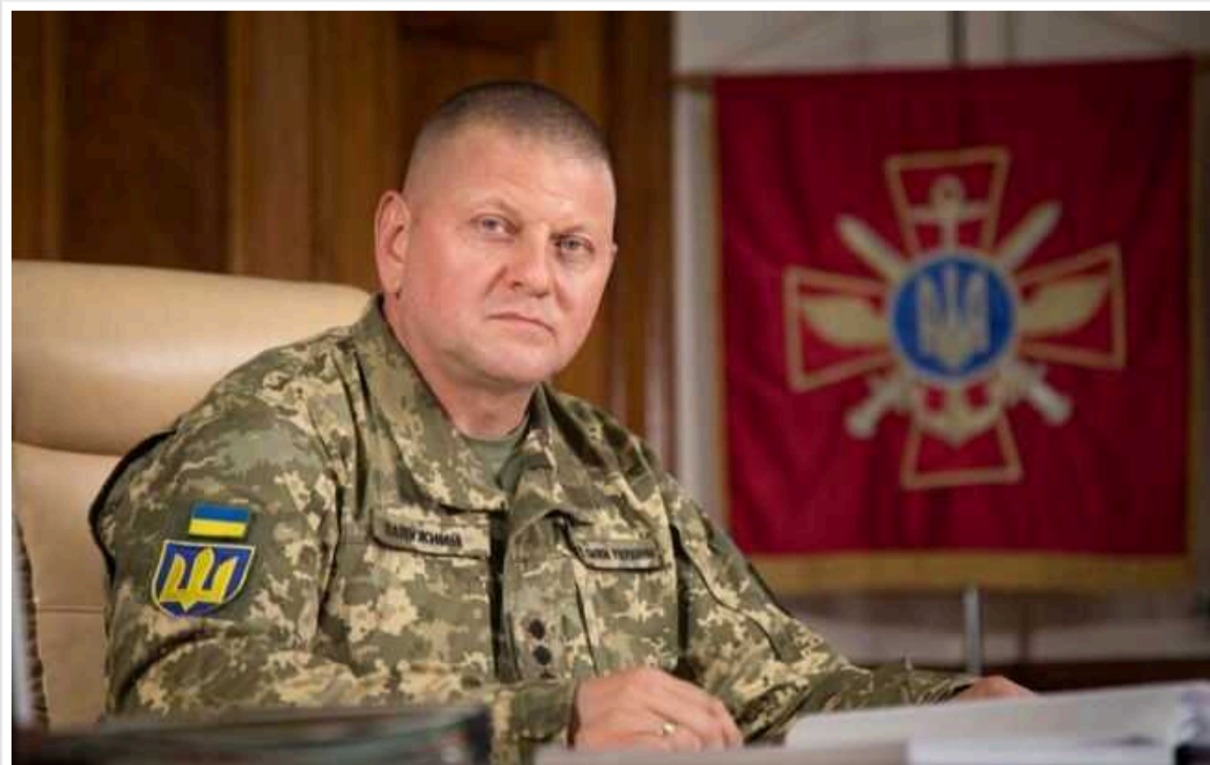
Político: Відправлений у відставку головом ЗСУ Валерій Залужний відмовлявся дотримуватися рекомендацій радників США щодо проведення літнього наступу на російську армію

Видання Politico повідомляє, що відправлений у відставку головом ЗСУ Валерій Залужний відмовлявся дотримуватися рекомендацій радників США щодо проведення літнього наступу на російську армію, яка закінчилася провалом.