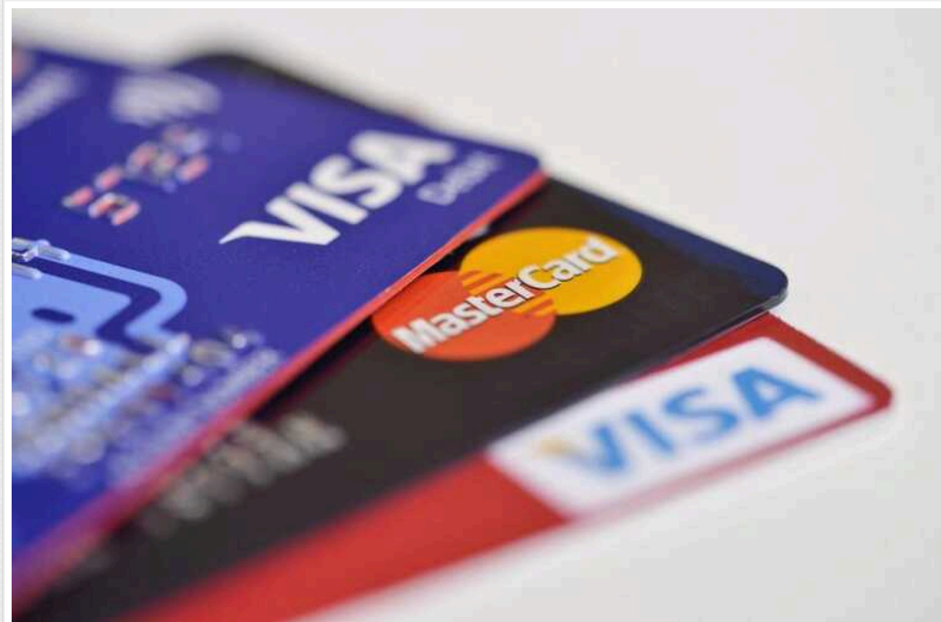
Visa заблокувала ймовірні шахрайські трансакції на 40 мільярдів доларів, - Bloomberg

Платіжна система Visa впродовж 2023 року заблокувала рекордну кількість імовірних шахрайських трансакцій – на $40 млрд.