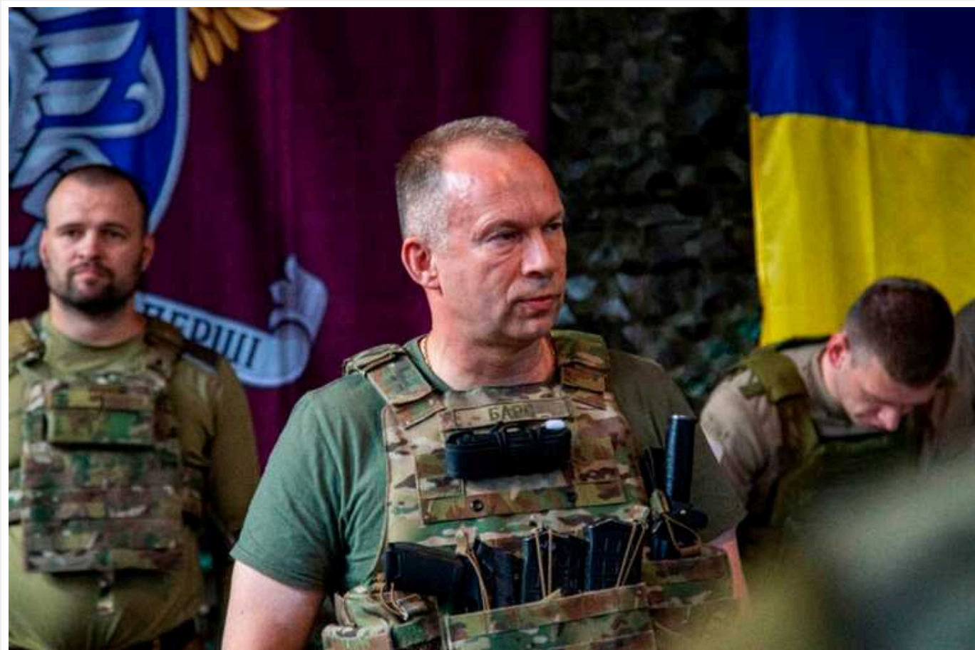
Сирський став новим Головнокомандувачем ЗСУ

"Я призначив генерал-полковника Сирського Головнокомандувачем Збройних Сил України", - розповів Зеленський у вечірньому зверненні.