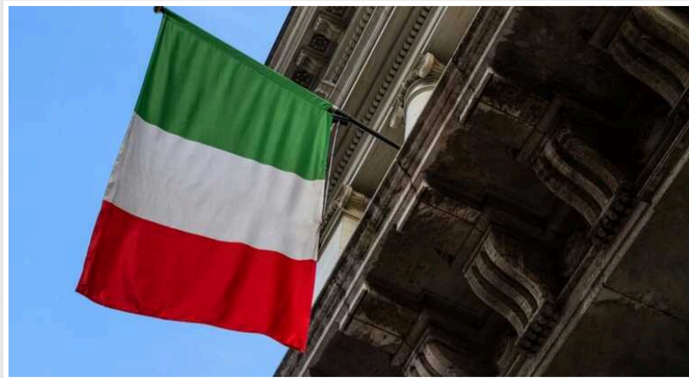
В Італії парламент проголосував за продовження військової допомоги Україні

Парламент Італії схвалив рішення, яке розширює повноваження на передачу військової техніки та іншого обладнання Україні. Варто зазначити, що із 260 депутатів 218 проголосували за, але 42 особи виступили проти.