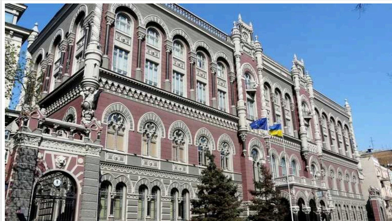
НБУ розіслав банкам на перевірку фінмоніторингу список із 150 українських блогерів, - ЗМІ

Джерела ЗМІ повідомляють, що Нацбанк України розіслав банкам на перевірку фінмоніторингу список із 150 українських блогерів.