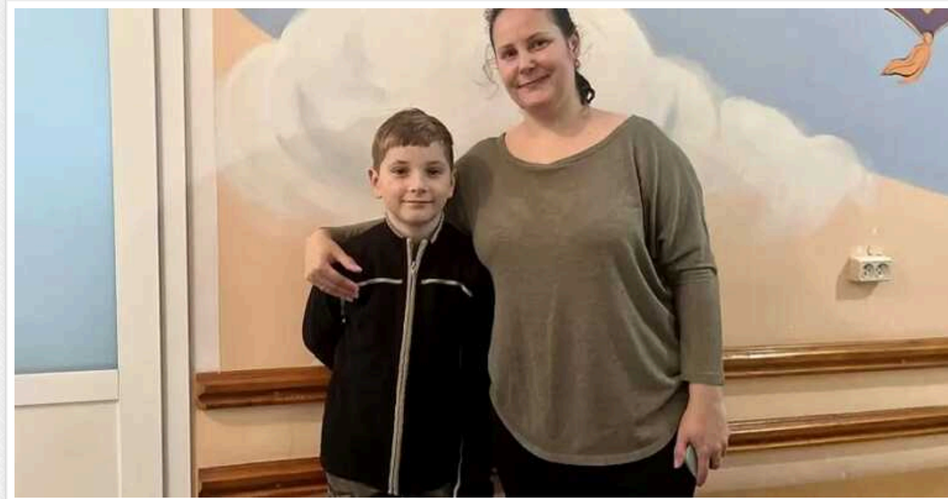
8-річний хлопчик зі Львівщини півтора року жив з хвойною гілочкою у бронхах

Причину постійних захворювань дитини встановили не відразу, підозрювали навіть туберкульозну пневмонію.