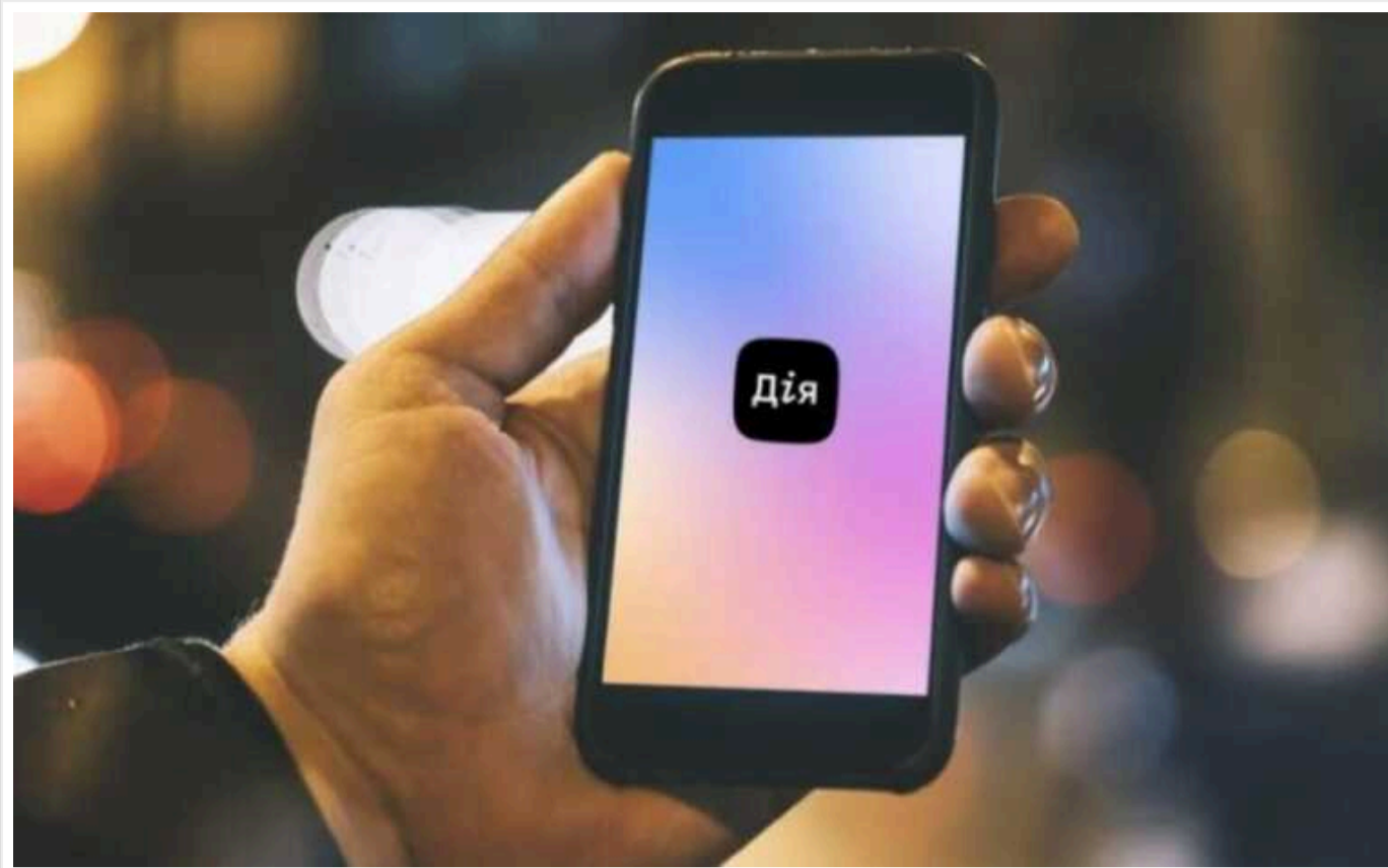
У Мінцифри спростовують слова свого голови Михайла Федорова, який допустив появу електронного військового квитка в "Дії"

Міністерство окремим коментарем заявило журналістам, що військового квитка та електронного кабінету призвоника у "Дії" не буде.