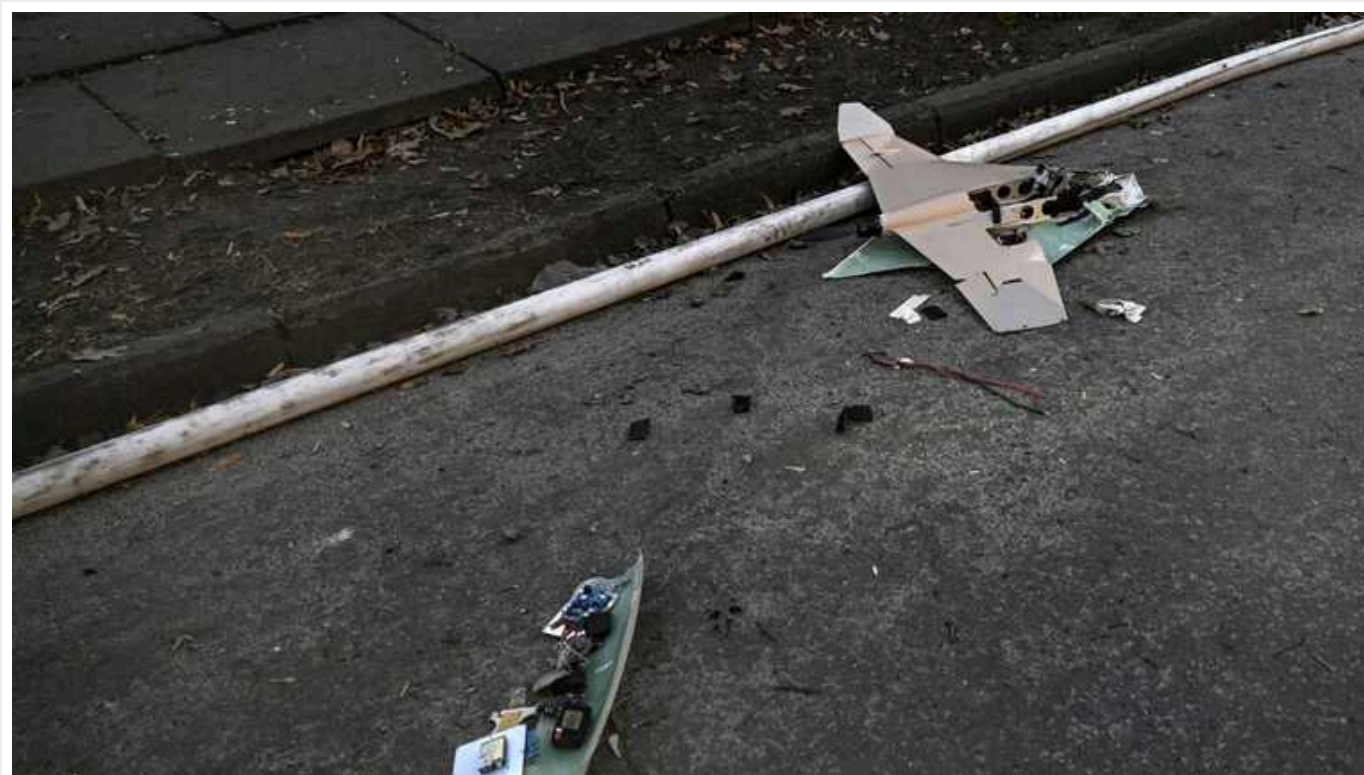
За добу на Таврійському напрямку українські захисники знищили 178 дронів ворога

Українські військові продовжують ефективно утримувати оборону в операційній зоні Оперативно-стратегічного угруповання військ "Таврія", при цьому завдаючи суттєвих втрат противнику. Так, лише за минулу добу захисникам вдалося нейтралізувати або знищити 178 ворожих безпілотників різних типів.