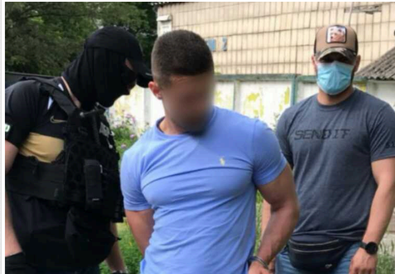
Експосадовець "Укртрансбезпеки" отримав 5,5 років в'язниці та конфіскацію майна за побори зі столичних перевізників

Вироком Госполітсуду до 5 років в'язниці позбавлення волі засуджено колишнього виконавця обов'язків начальника Північного міжрегіонального управління "Укртрансбезпеки". Його обвинувачували у поборах з перевізників.