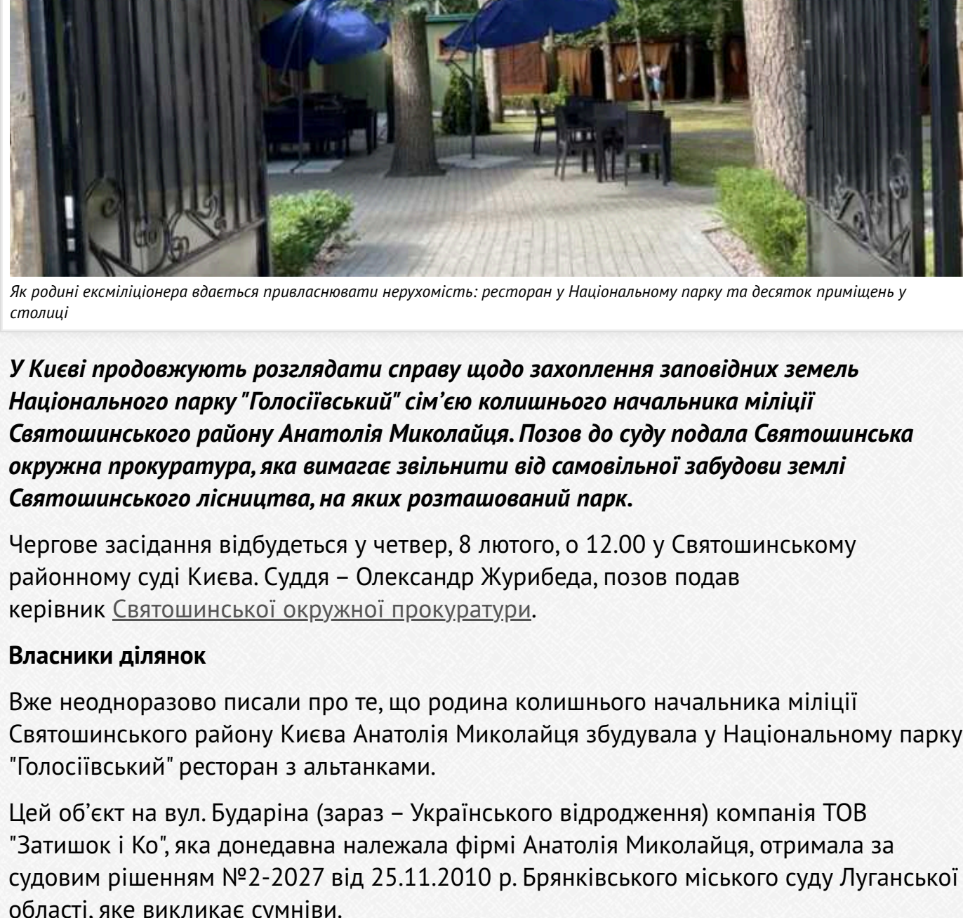
Як родині ексміліціонера вдається привласнювати нерухомість: ресторани у Національному парку та десяток приміщень у столиці