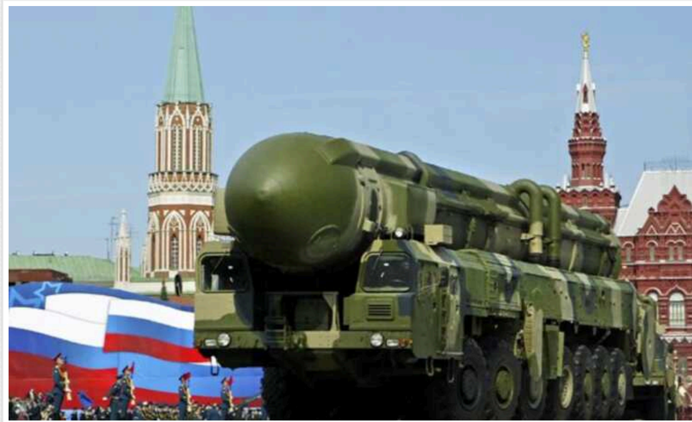
РФ брязкає "ядерною шаблею" в надії зірвати допомогу Заходу для України, – ISW

Заступник голови Ради Безпеки Російської Федерації Дмитро Медведєв продовжив свою риторику брязкання "ядерною шаблеюю", що частково спрямована на стримування західної допомоги Україні.