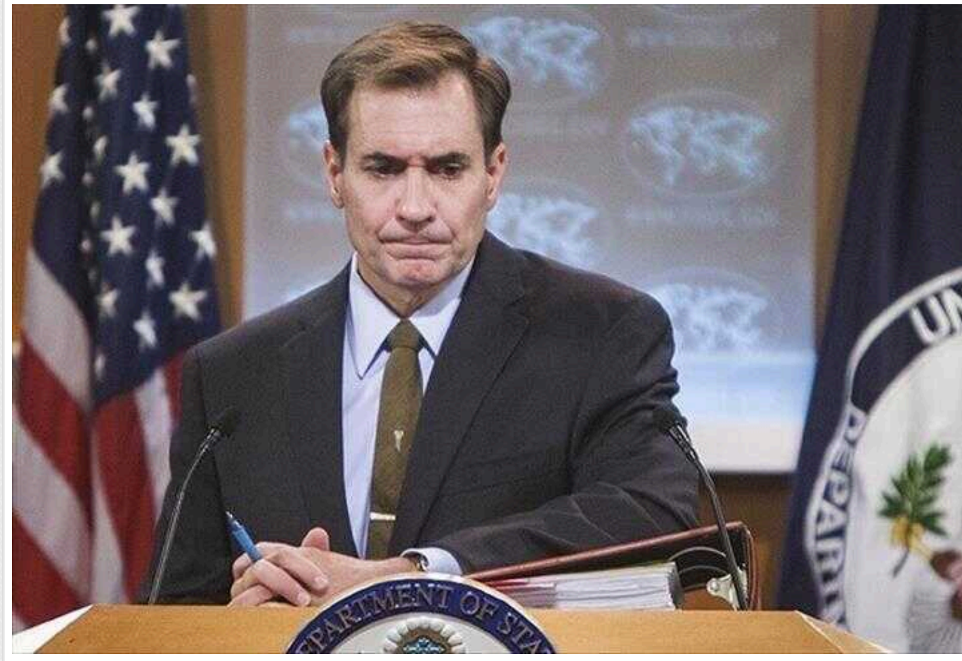
У Білому домі відреагували на інтерв'ю пропагандиста Карлсона з Путіним

В адміністрації президента Сполучених Штатів Америки (США) вважають інтерв'ю скандального американського медійника Такера Карлсона з російським диктатором Володимиром Путіним просто непотрібним.