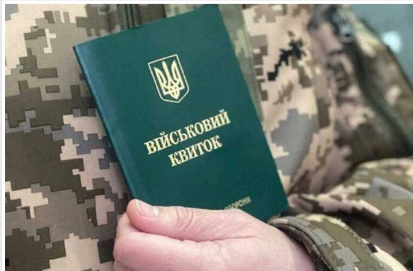
В РНБО запевнили, що з антиконституційними нормами закон про мобілізацію не ухвалять

Секретар Ради національної безпеки і оборони України Олексій Данилов сказав, що оновлений законопроект про мобілізацію не буде ухвалено, якщо він матиме антиконституційні норми. Президент Володимир Зеленський та самі нардепи цього не допустять.