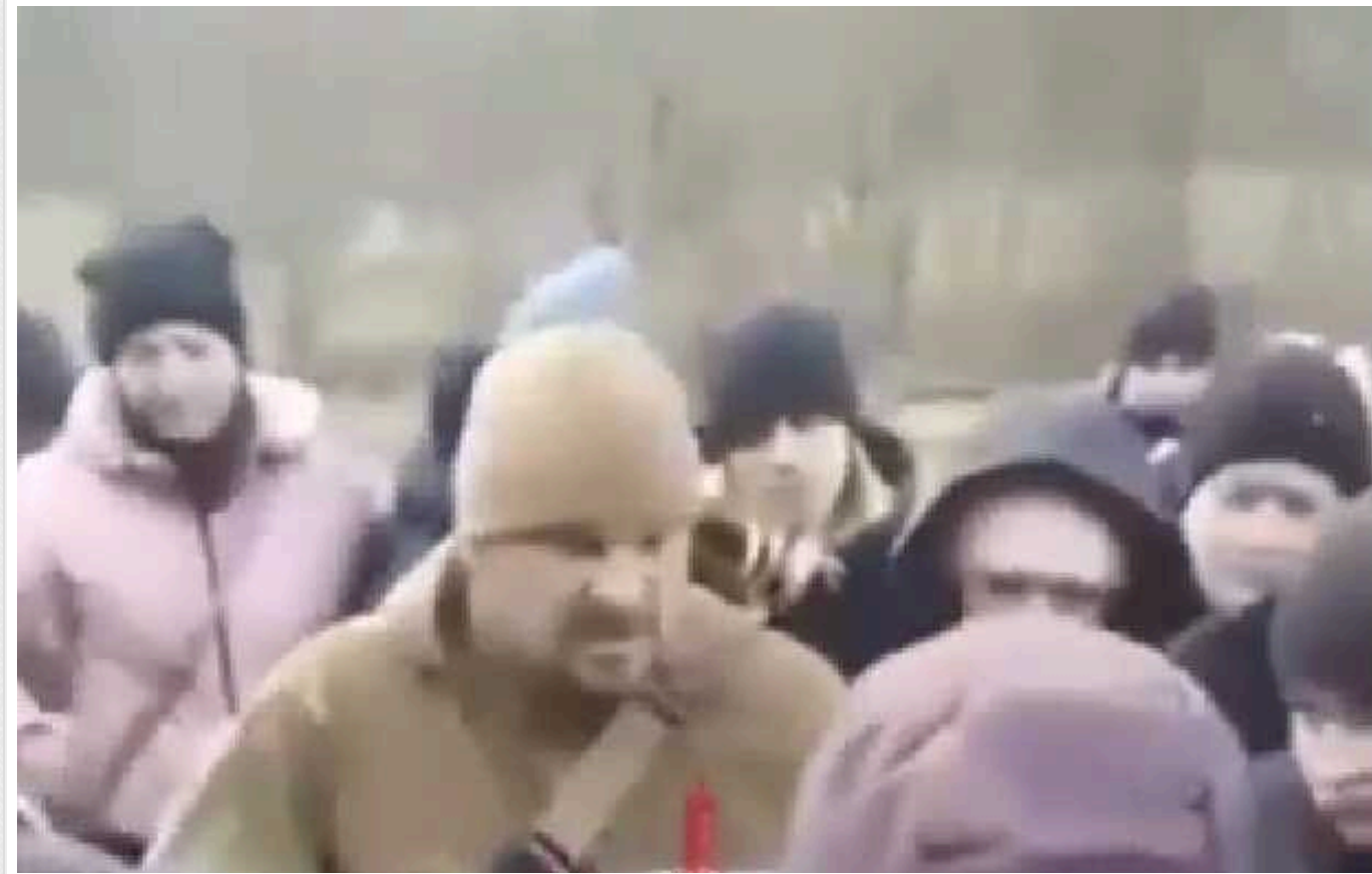
«У нас війну не оголошено!»: на Івано-Франківщині місцеві жінки заблокували співробітників ТЦК

Місцеві жінки у Космачі, Івано-Франківської області після приїзду ТЦК вийшли проти мобілізації місцевих чоловіків та оточили співробітників територіального центру комплектування.