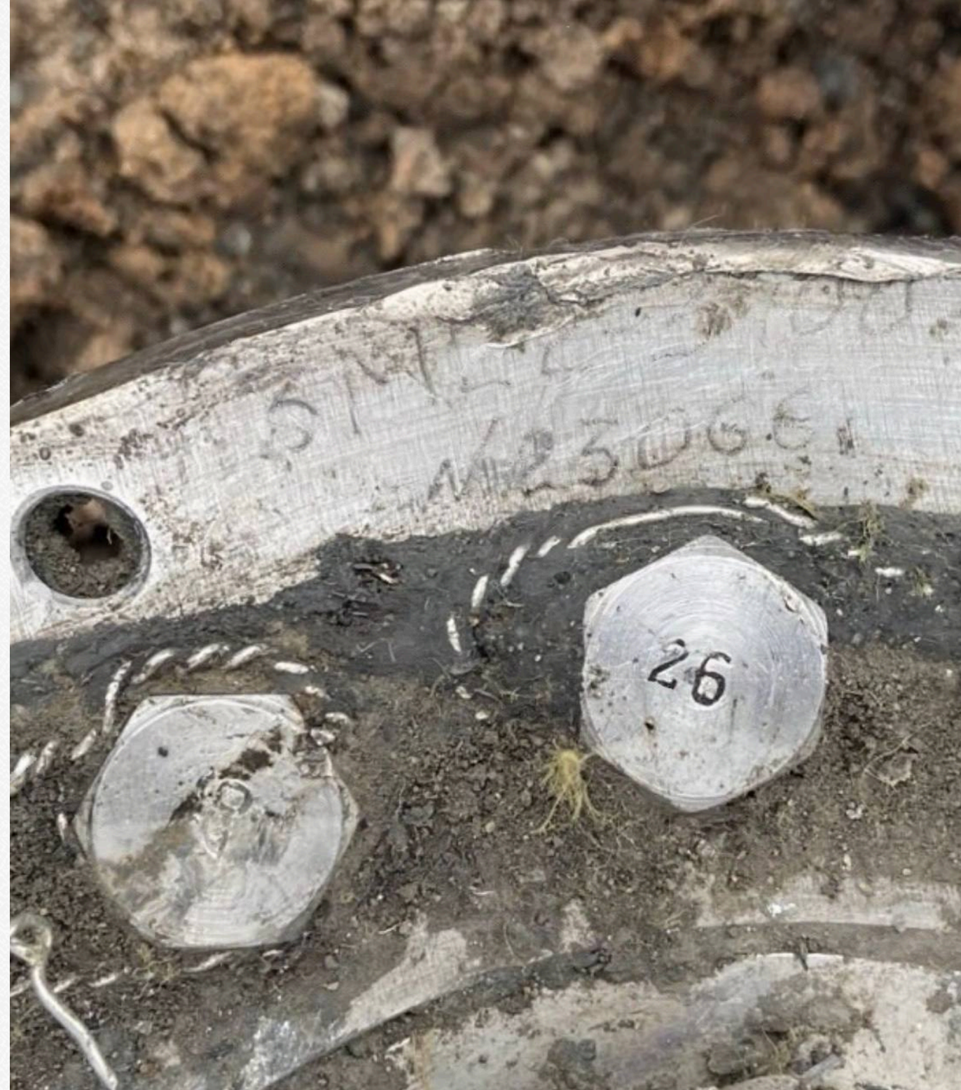
Фото: уламки невстановленої ракети, яку збили над Києвом

В Defence Express уточнили, що знайдені сьогодні уламки відповідають уламкам іншої невстановленої ракети, яку РФ використала на початку року. Щодо тієї іншої невстановленої ракети також було припущення, що це може бути "Циркон".