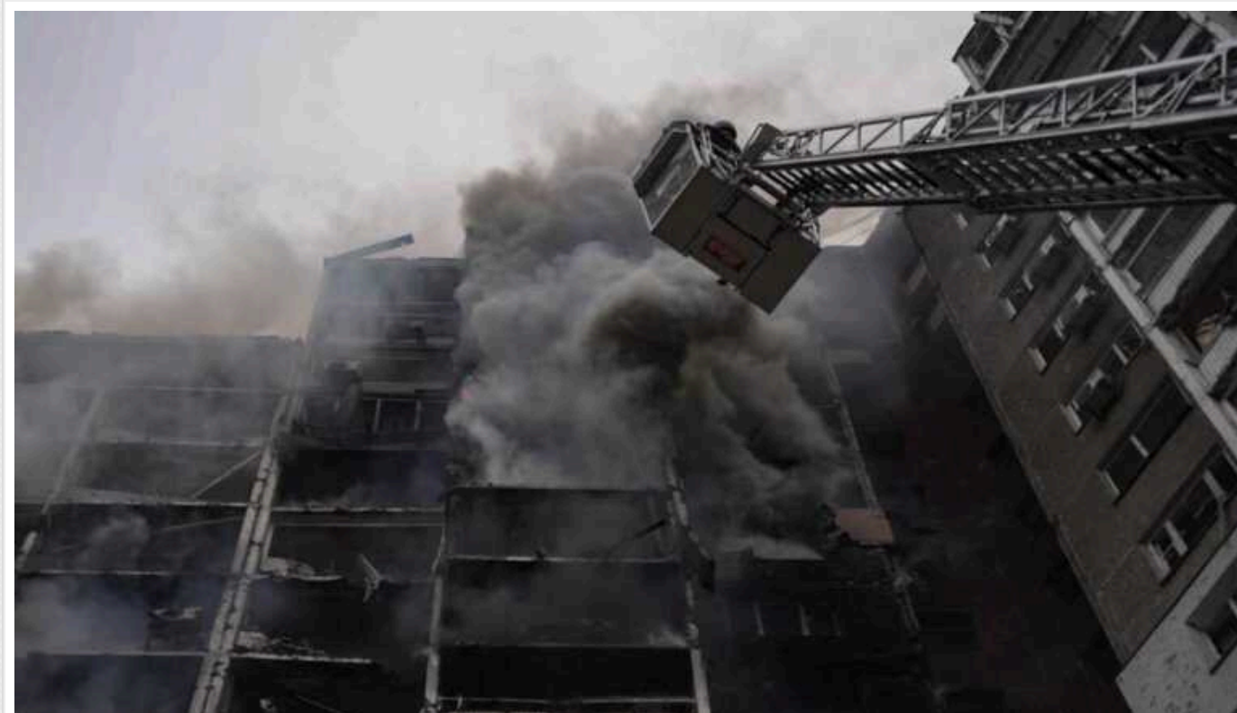
Що відомо про "вундерваффе" Путіна, і чи могла РФ запустити ракету "Циркон" по Києву

Росіяни під час ранкової атаки на Київ могли запустити гіперзвукову ракету "Циркон", яка офіційно ще жодного разу не застосовувалась у бойових умовах, і її, ймовірно, збили українські Сили протиповітряної оборони. Російський диктатор Володимир Путін особисто вихвалявся цією "суперброєю".