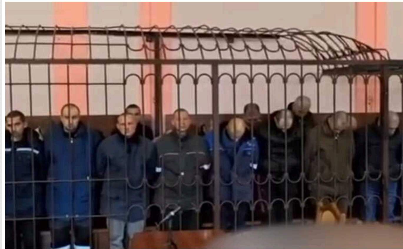
Український омбудсмен звернувся до ООН та Червоного Хреста через суд над 33 українськими військовополоненими

Так званий "верховний суд ДНР" провів судилище над 33 українськими захисниками. Їх звинуватили в нібито обстрілах житлових будинків так званої "республіки" та призначили від 27 до 29 років ув'язнення.