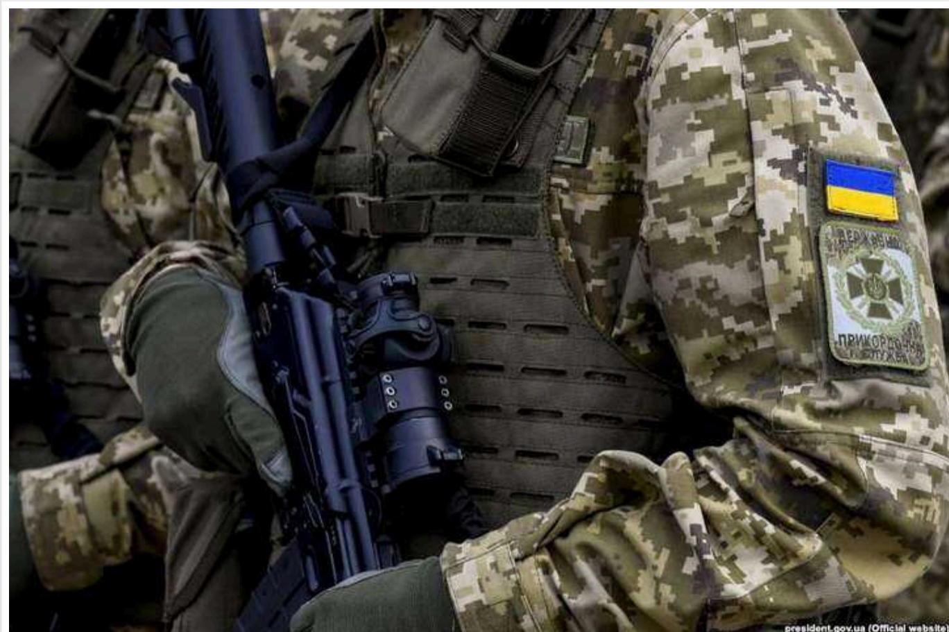
Конфлікт у поліції на Дніпропетровщині: спецпризначенці, які обурювалися перспективою відправлення на фронт, перевели до штурмової бригади «Лють»

Усіх дніпровських спецпризначенців, які обурювалися перспективою відправлення на фронт, таки перевели до штурмової бригади "Лють", а їхній полк особливого призначення розформують.