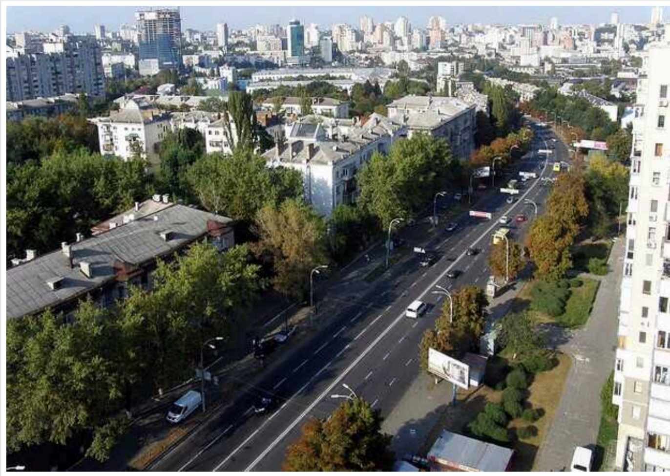
Київрада сьогодні проголосує за перейменування Повітрофлотського проспекту на честь Повітряних сил України, – мер