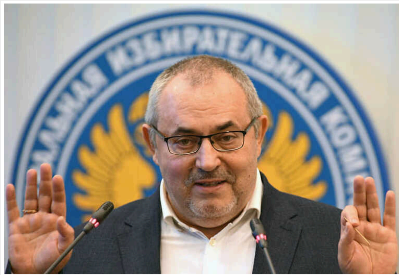
ЦВК Росії відмовила в реєстрації кандидатом на пост президента РФ Борису Надеждіну, який вважався єдиним «антивоєнним» учасником виборів

Комісія визнала недейсними 9147 підписів на його підтримку.