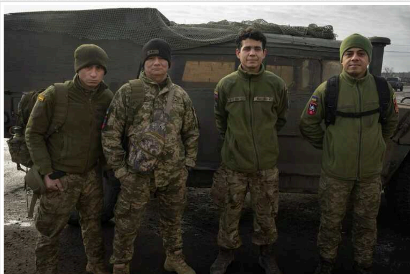
Професійні солдати з Колумбії, щоб заробити, приїжджають добровольцями воювати в Україні з РФ, – Associated Press

У Колумбії друга за величиною армія в Латинській Америці після Бразилії – 250 тис. осіб. Щороку на пенсію виходять понад 10 тис. військових. І сотні вирушають воювати до України, де можна заробити вчетверо більше, ніж на батьківщині. А то й більше.