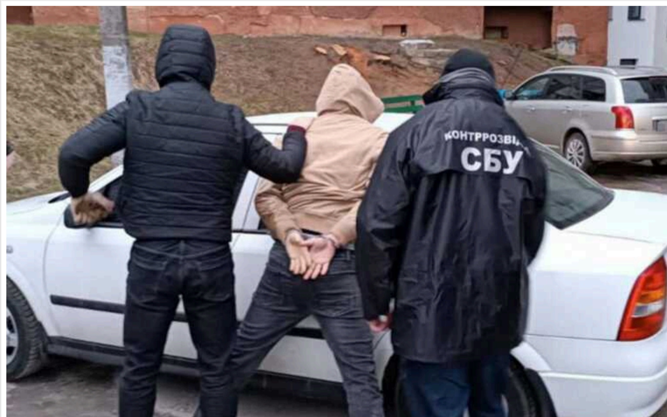
Нацполіція та СБУ затримали колаборанта, який допомагав окупантам ув'язнювати українців на тимчасово окупованій частині Запоріжжя

Служба безпеки та Національна поліція запобігли втечі з України колаборанта, який входить до складу окупаційного «МВС РФ» у тимчасово захопленій частині Запоріжжя. Зловмисник брав участь в ув'язненні місцевих учасників руху опору.