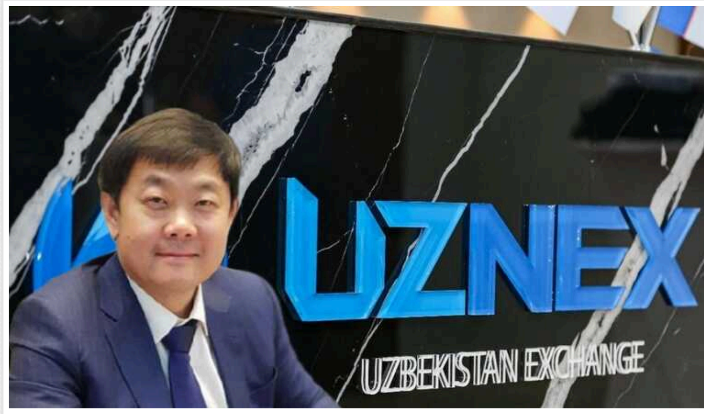
Високопосадовця з Узбекистану звинуватили в шахрайстві та обході санкцій на користь чиновників та олігархів з Росії

Голова Національного агентства перспективних проєктів (НАПП) Узбекистану Дмитро Лі став об'єктом підозр у здійсненні шахрайських операцій, пов'язаних із платіжними системами та відмиванням грошей підсанкційних російських чиновників та олігархів.