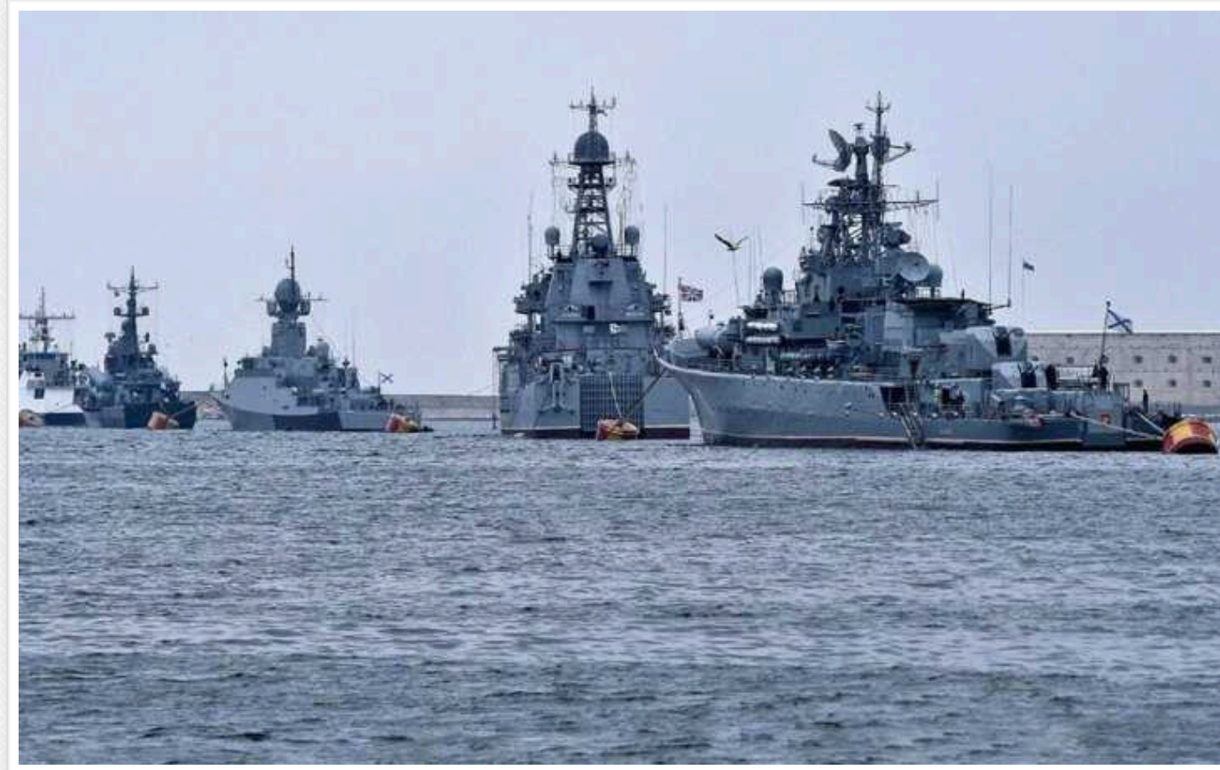
Росія завела ракетносії у пункти базування через шторм на морі

Кораблі-ракетносії Російської Федерації в Чорному морі станом на ранок 8 лютого були відведені в пункти базування. Причина – штормова погода.