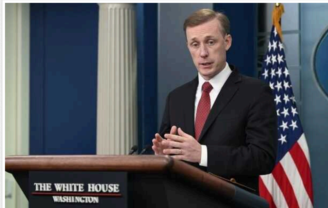
США не мають альтернативи, окрім як надати допомогу Україні, – Салліван

У Білому домі заявили, що у США немає "плану Б", якщо підтримка Києва і надалі блокуватиметься в Конгресі, тому сподіваються отримати від законодавців додаткове фінансування для України.