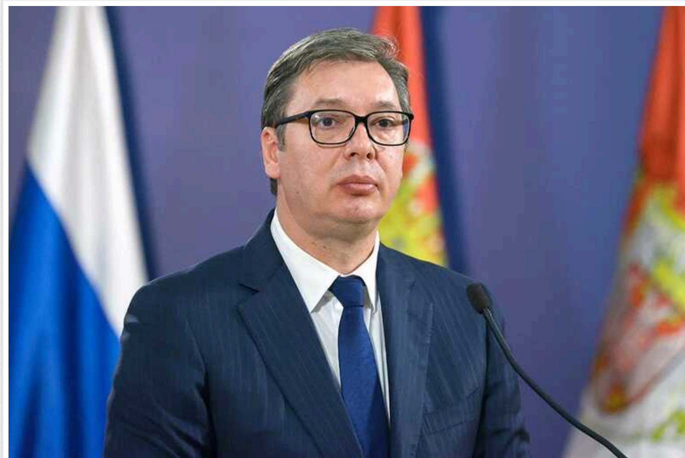
Україна проведе саміт із країнами Західних Балкан, – президент Сербії Вучич

Найближчим часом Україна проведе саміт із країнами Західних Балкан.