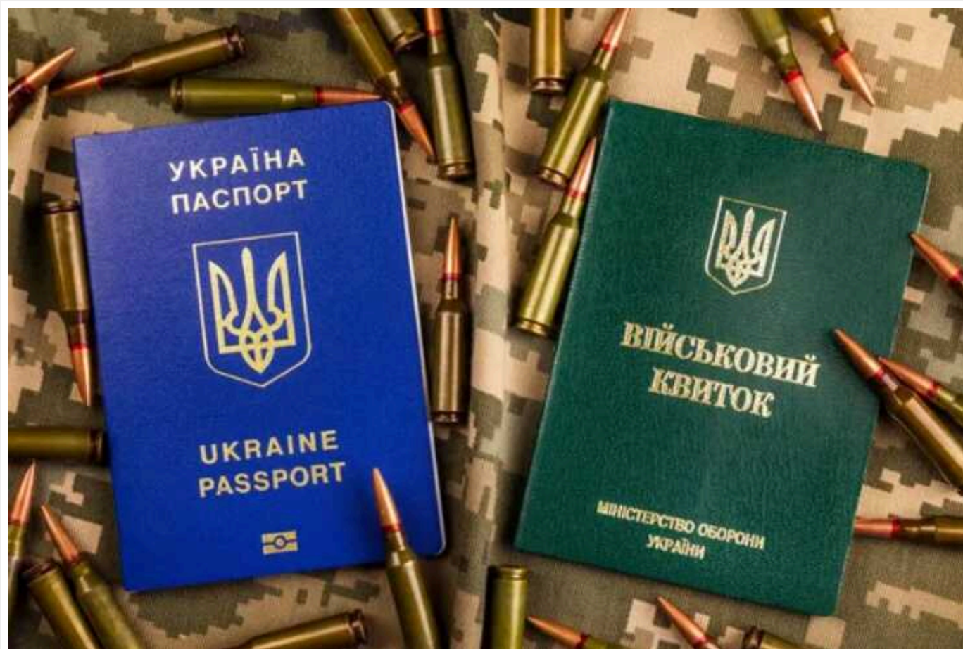
Які категорії українців втратять право на бронь за новим законопроектом про мобілізацію

7 лютого депутати Верховної Ради України підтримала в першому читанні урядовий законопроект №10449 про мобілізацію. Серед іншого цей проєкт закону передбачає зміни в порядку бронювання військовозобов'язаних.