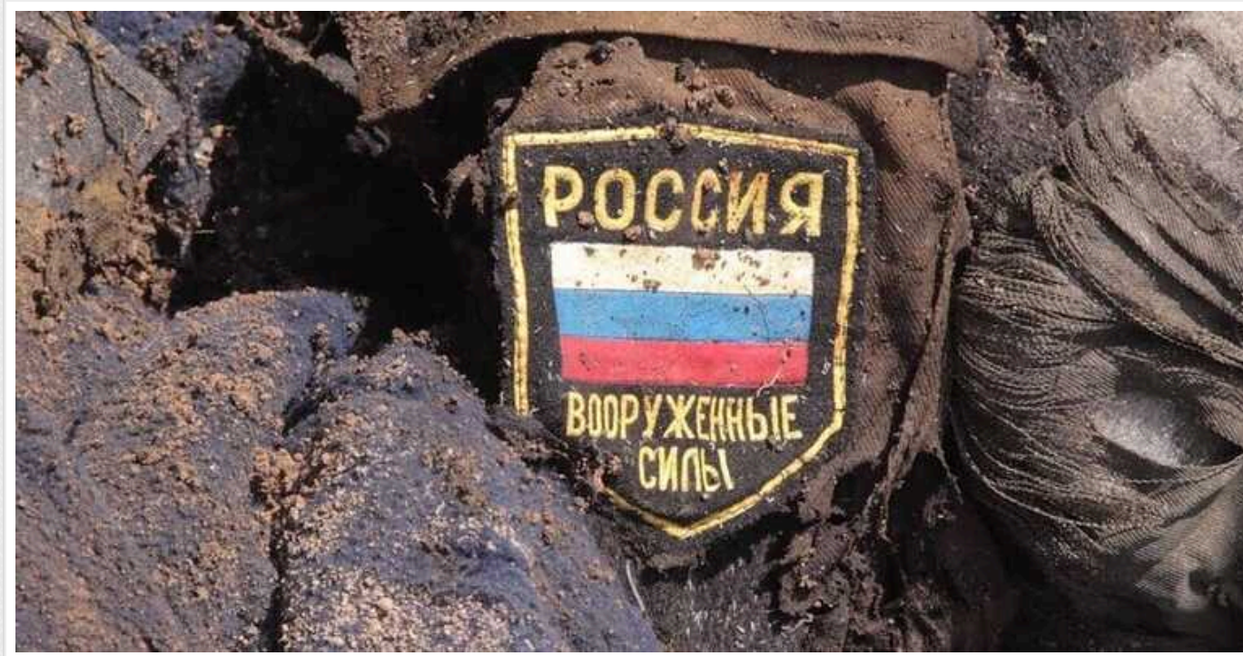
Втрати ворога: ЗСУ за добу ліквідували 910 окупантів і гелікоптер

Росія продовжує зазнавати втрат у загорбницькій війні проти України – лише за минулу добу Сили оборони ліквідували понад 900 окупантів, 24 артилерійські системи і гелікоптер.