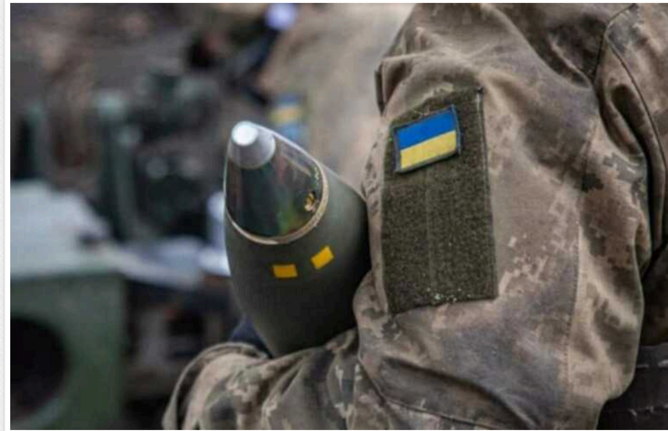
Шольц: Україна незабаром може зіткнутися із серйозним дефіцитом зброї та боєприпасів

Про це повідомив канцлер Німеччини Шольц в авторській колонії Wall Street Journal.