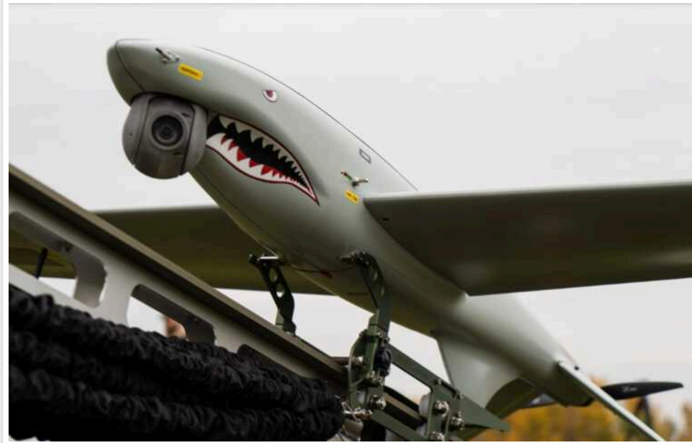
Ukrspesystems буде інтегрувати у БПЛА SHARK штучний інтелект

Українська компанія Ukrspesystems працює над інтеграцією штучного інтелекту до розвідувальних безпілотників SHARK.