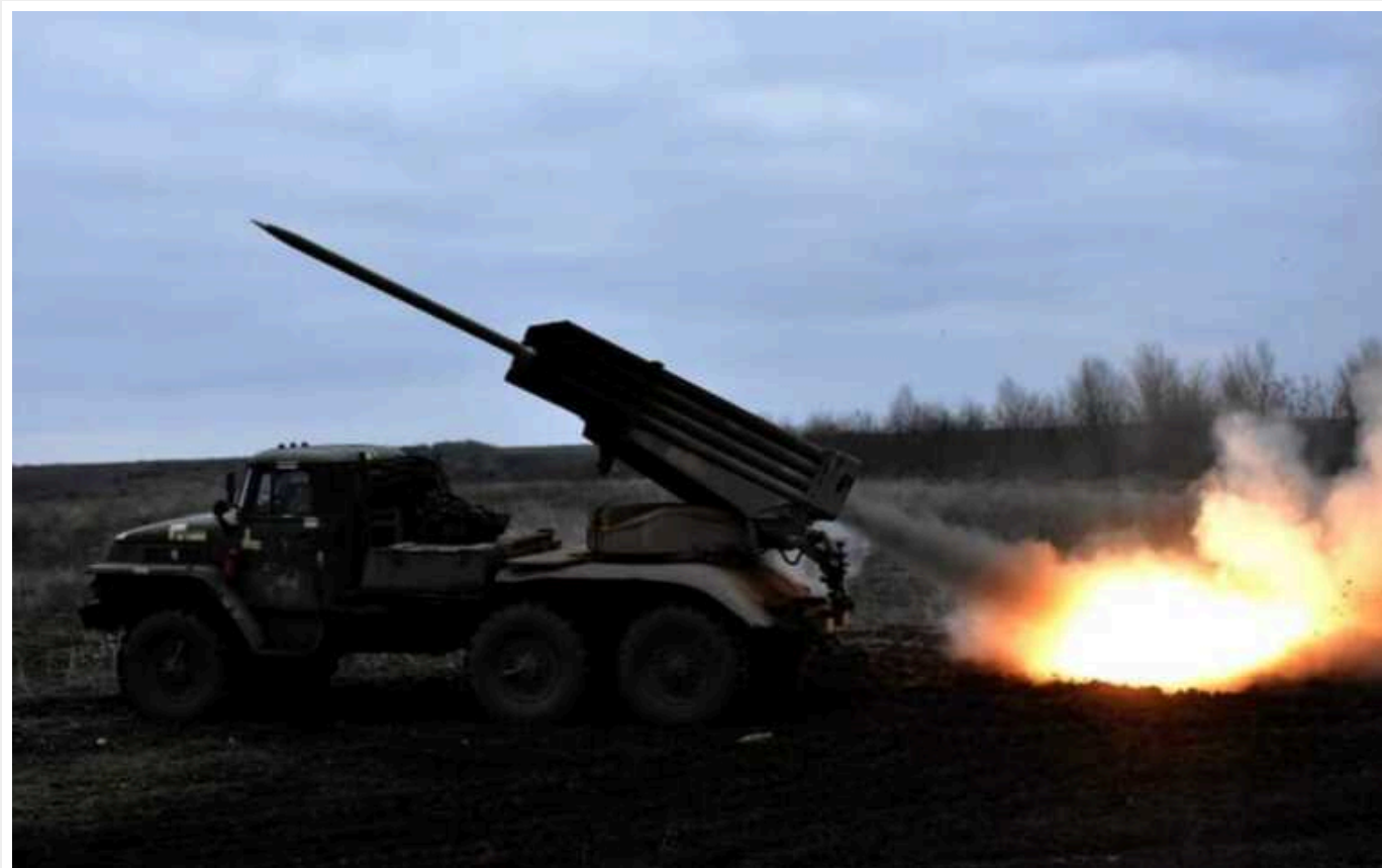
Ситуація на фронті: Збройні сили відбили атаки на 6 напрямках

Армія РФ намагається наступати на Куп'янському, Лиманському, Бахмутському, Авдіївському, Мар'їнському та Запорізькому напрямках. ЗСУ минулої доби відбили 27 атак в районах Новобахмутівки, Авдіївки.