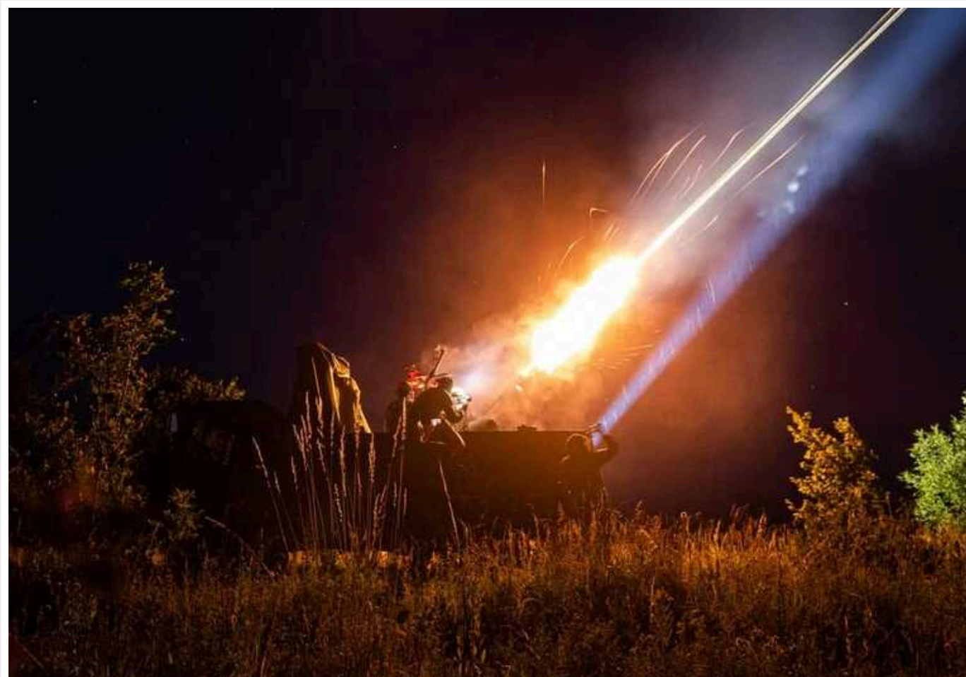
Повітряні сили вночі знищили 11 "шахедів"

У ніч на 8 лютого 2024 року противник завдав удару 17-ма ударними БпЛА типу Shahed-136/131 з мису Чауда – Крим.