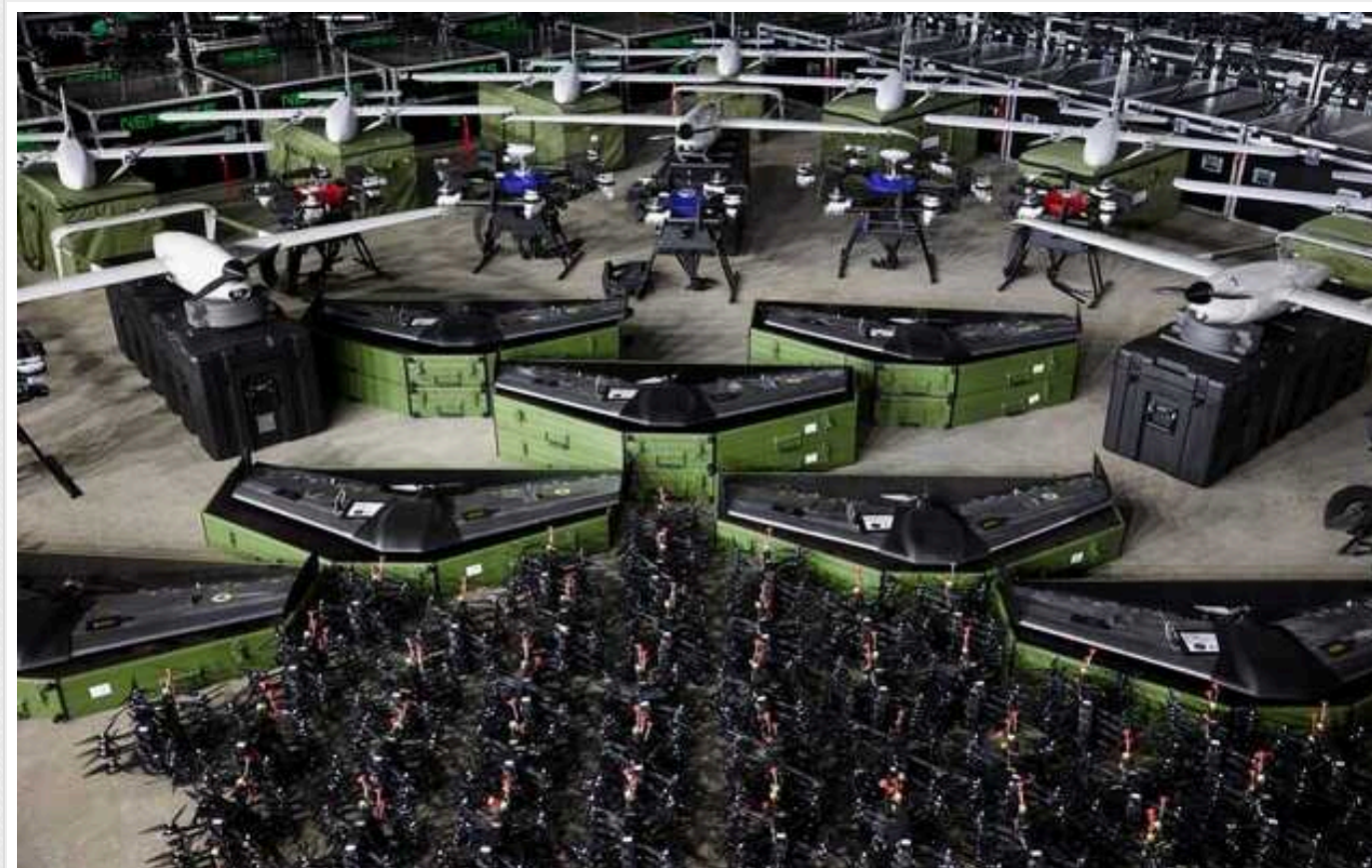
В Україні за пів року виробництво дронів збільшилось у 10 разів, – The Wall Street Journal

Україна активно нарощує виробництво дронів, які знаходять широкий спектр застосування – від заміни артилерійських снарядів, яких не вистачає, до ударів по кораблях Чорноморського ВМФ і військових і промислових об'єктів на території самої Росії.