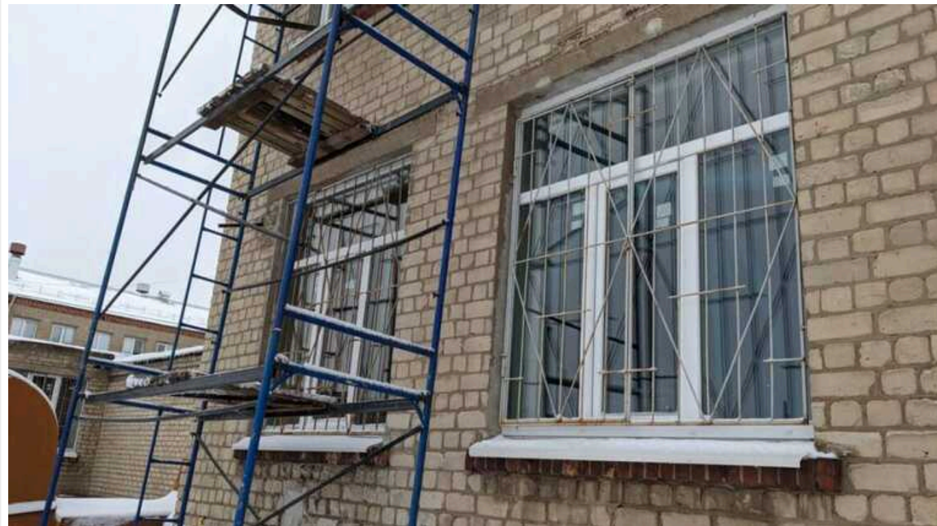
НАБУ розпочало розслідування у справі щодо привласнення коштів Харківської міськради

НАБУ розслідує імовірне заволодіння коштами Харківської міської ради під час закупівлі нею металопластикових вікон за завищеною на понад 26 млн гривень вартістю. Вікна купляли для виконання аварійно-відновлюваних робіт будівель в Харкові.