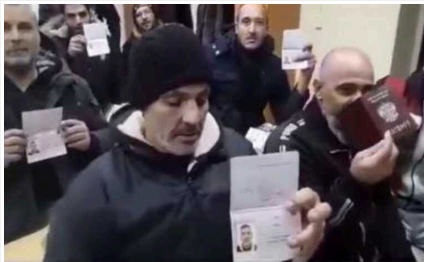
Країна-терористка активно заманює на війну проти України наївних підданих Асада