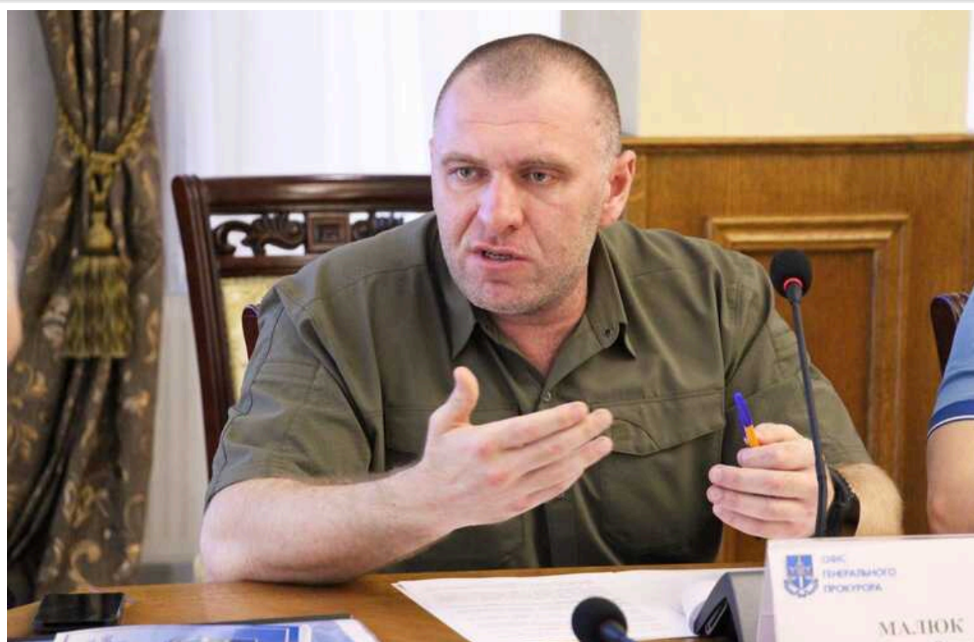
Малюк пояснив послам G7 ситуацію навколо редакції Bihus.Info: "Незалежність у роботі ЗМІ має бути забезпечена на 100%"

Очілюнок Служби безпеки України Василь Малюк 7 лютого зустрівся з послами держав G7 у Києві, обговоривши питання взаємодії та демократичного розвитку нашої країни під час війни. Він пояснив ситуацію, що склалася навколо редакції Bihus.Info, та кадрові рішення у СБУ після цього інциденту.