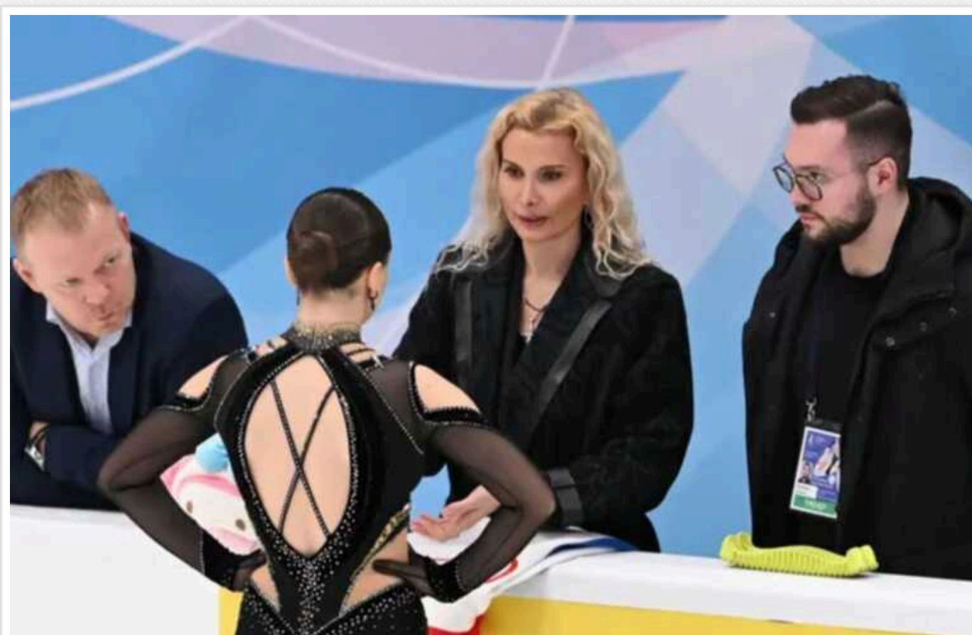
CAS вперше опублікував усі деталі допінгової справи Валієвої

Спортивний арбітражний суд (CAS) опублікував мотивувальну частину у справі про порушення антидопінгових правил російською фігуристкою Камілою Валієвою. 17-річна уродженка Казані спробувала пояснити, звідки в крові з'явився заборонений препарат триметазидин