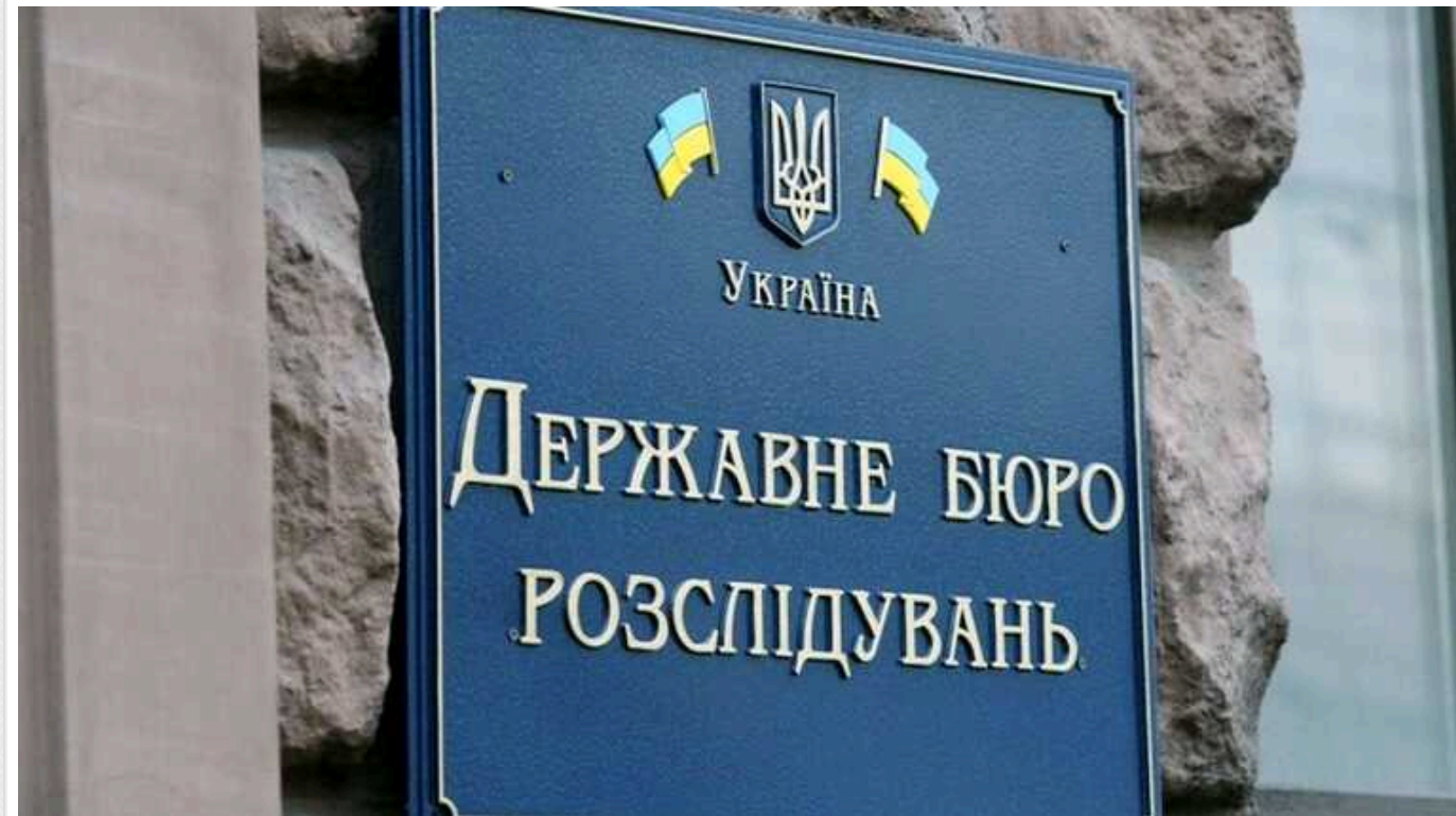
До ДБР передали ще одну справу про стеження за співробітниками Bihus.Info

Київська обласна прокуратура 7 лютого передала від Національної поліції до ДБР справу за заявами восьми співробітників Bihus.Info щодо незаконного стеження.