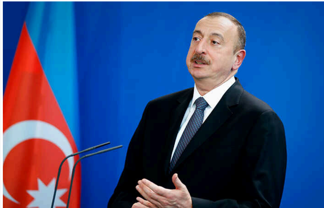
Вибори в Азербайджані: чинний президент Алієв лідирує з 93,9% голосів

В Азербайджані завершилося голосування на позачергових виборах президента у середу, 7 лютого. За даними екзитполів, лідирує чинний глава держави Ільхам Алієв.