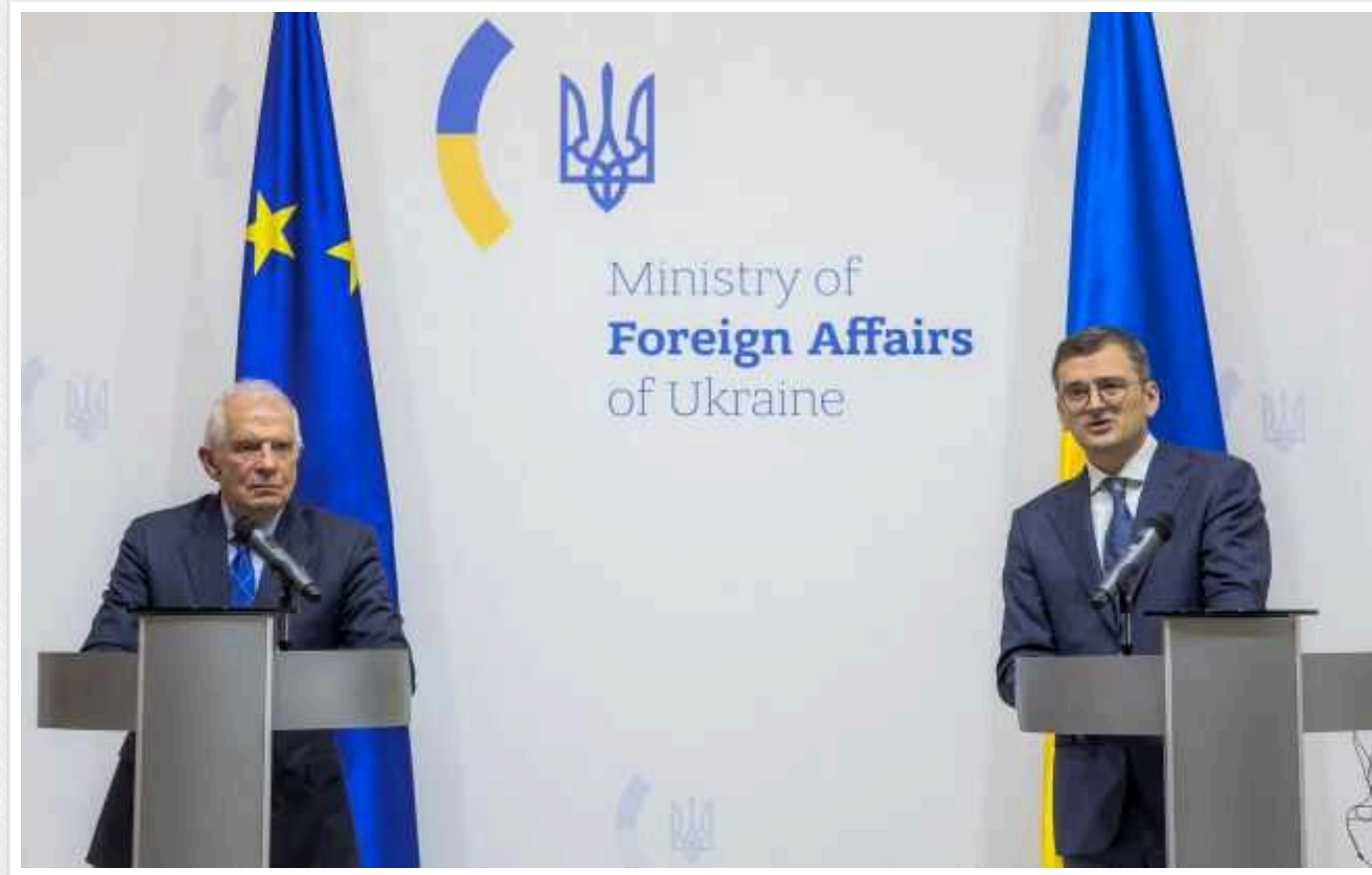
Боррель заявив про прогрес щодо питання російських активів. Кулеба закликав їх конфіскувати

Росія має заплатити за руйнування України, і це можна зробити за допомогою заморожених російських активів. Необхідно знайти спосіб для їх конфіскації.